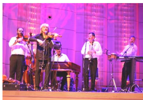
Na závěr vystoupil soubor Hradišťan