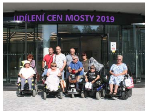
Část pozvaných hostů