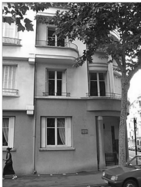
Rodný dům Valéry Larbauda