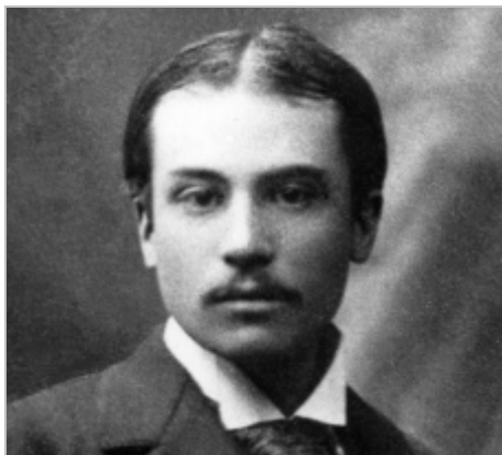
Valéry Larbaud jako mladík

Valéry kupodivu nežil příliš šťastně. Až moc chráněný a opečovávaný svou matkou se jako chlapec cítil nesvobodný a osamělý. Společnost nacházel právě mezi knihami a hovořil dokonce šesti jazyky. Později se rozhodl žít v Anglii, Španělsku a Itálii, kde naplno propukla jeho touha po studiu jazyků a cítil se i dostatečně daleko od svazujícího prostředí svého domova. Přelozil řadu knih také od autorů ze Španělska – Leopardiho, Ramona Gomeze de la Serna, Gabriela Miro. Rovněž stvořil jednu z nejpozoruhodnějších literárních postav 20. století – jihoamerického milionáře A. O. Barnabootha – vzdělaného diletanta s neuhasi-