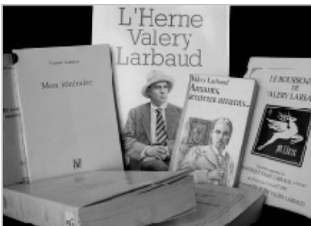
Některé z knížek Valéry Larbauda

Larbaud zemřel ve svém rodném Vichy v roce 1957 po dvacetiletém utrpení, kdy se k němu štěstěna obrátila zády nejen co se zdraví týče, ale také po stránce finanční. Byl nucen rozprodat svůj majetek a především svou knihovnu čítající na 15 tisíc svazků knih. I přes potíže spojené s chorobou dál přijímal pocty a čestné tituly, které si svou literární čin-