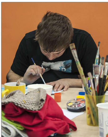
Arteterapii k sebepoznání

Na setkáních budeme tvořit, ale budeme o dílech také mluvit – o tom, co jsme vytvořili a jaké to pro nás bylo. Budeme mluvit o významech, pocitech náladách či přáních. Využijeme také krátké relaxace a imaginace.