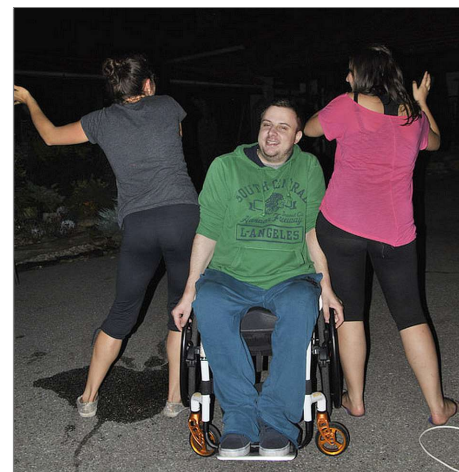
Nechte se u nás pošouchnout k aktivitě!