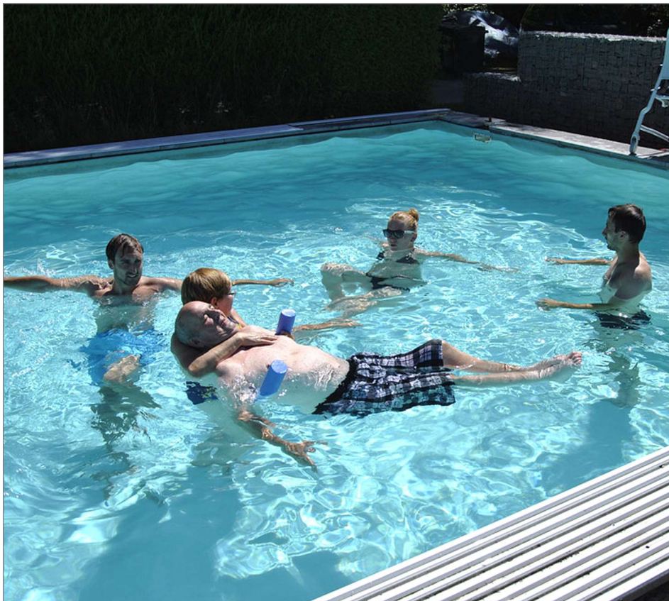
V bazénu se vozičkář může spolehnout na pomoc asistentů

Kvůli rekonstrukci „Pavilonu Praha“, jehož součástí jsou velké pokoje, tělocvična, rehabilitační a společenská místnost,