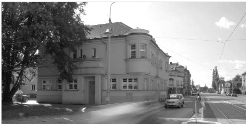
Pohled na knihovnu od tramvajové zastávky na Závodní ulici. Vlevo ve dvoře je parking

Příznávám se Vám upřímně, že nás moc mrzí, že za těch 5 let naše služby nevyužil