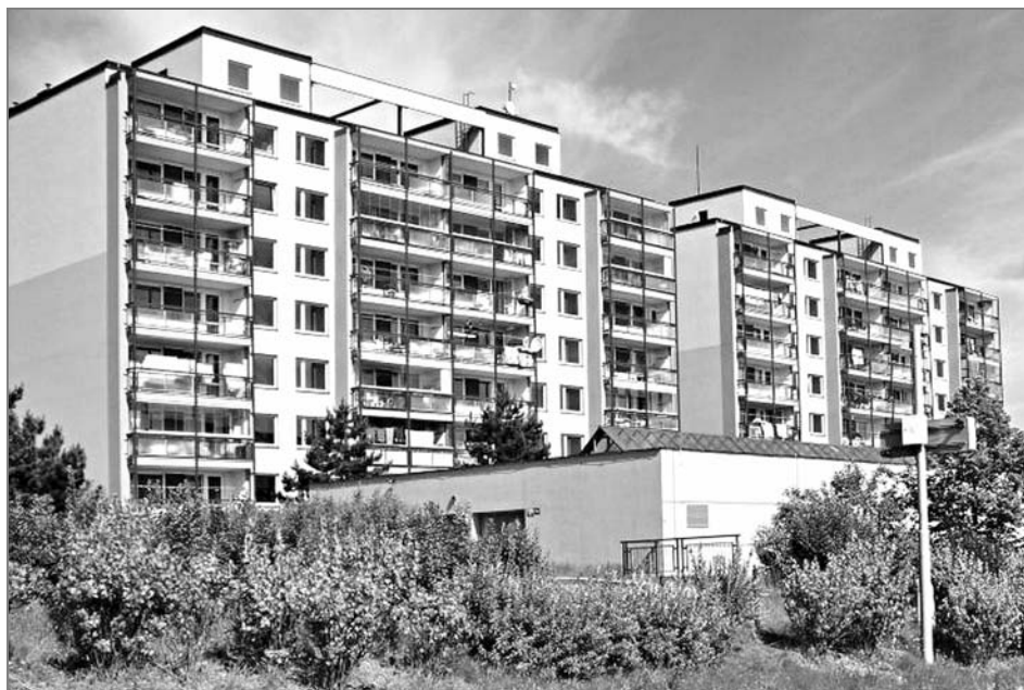
Bezbariérový dům Klubu vozíčkářů Petýrkova v Praze-Chodově

O rok později prošla organizace důležitou změnou právní formy, když se z občanského sdružení transformovala na