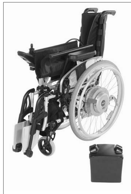
Složení vozíku s z50