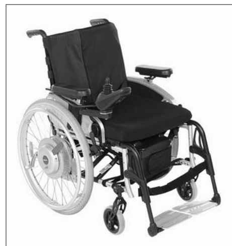
z50 na vozíku Avantgarde CV

vy o dynamičnosti, vytrvalosti a každodenní svobodě. Stačí připnout, zajistit a můžete vyrazit. A po výletě můžete vozík opět složit.