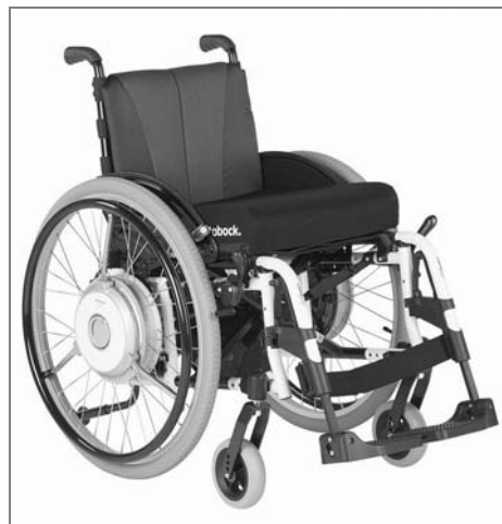
eSupport na vozíku Motus

Pohon eSupport vám dodá právě tolik podpory, kolik potřebujete. Citlivé senzory měří energii, kterou vkládáte do hnacích kol. Dva elektromotory pak přidají přesně takovou pomoc, která je v daném terénu potřeba pro plynulou jízdu. Aby byla jízda bezpečná, můžete kdykoliv přepínat mezi interiérovým a exteriérovým režimem.