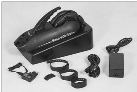
Pohonná jednotka s nabíječkou