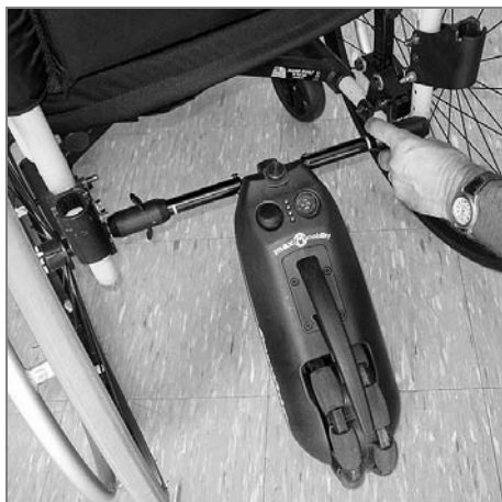
Nasazení osy je jednoduché

SmartDrive MX2 jde používat na vozíky jak s pevným rámem, tak i na skládací. Na skládací vozíky je potřeba pevná zadní osa , na které je upevněna úchytová objímka pro motor, proto výrobce vyvinul teleskopickou osu.