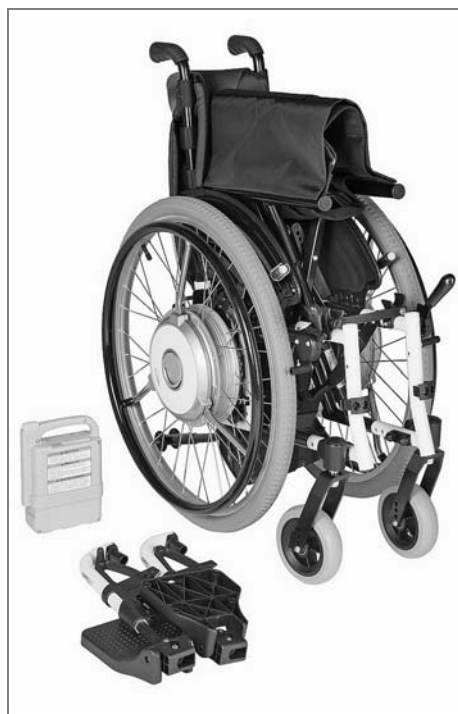
Složení vozíku s eSupportem

Pohon eSupport je kompatibilní s mechanickými vozíky Ottobock řady Start, Motus, Avantgarde CV a Avantgarde CS. Montáž přídavného pohonu provádí výrobce.