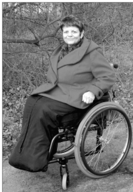
Autorka článku ve svém posledním modelu – fusaku s kabátkem.

Přikládám kontakt na mou dcerku pro ty, co by nějaký fusak chtěli, ale nemají vhodnou švadlenu nebo krejčovou. Vysvětlí vám, jak naměřit míry na velikost fusaku a koupí látky. Cena za ušití základního pytle je 500 Kč bez materiálu.