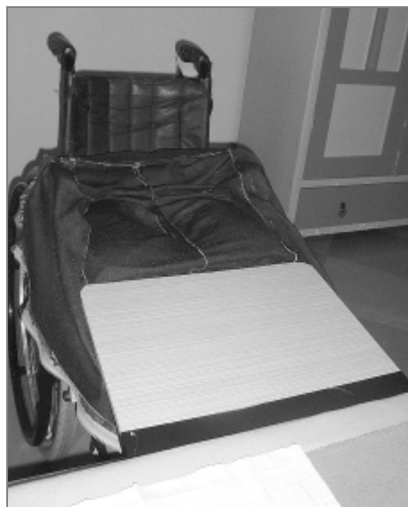
Lůžko – přesouvací deska – vozík

■ Protože fusak na mě čeká připravený na vozíku, mám spodní část těla oblečenou velmi rychle, snadno a bez námahy. Stačí se přesunout a zapnout zip.