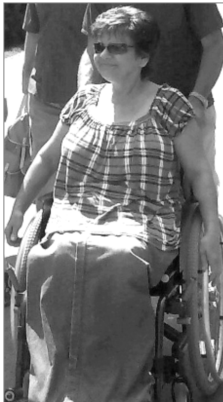
Lehký letní fusak s dvojcestným zipem

Pro letní fusaky se osvědčil dvojcestný zip, protože když je horko, stačí od kotníků zip otevřít a větrat.