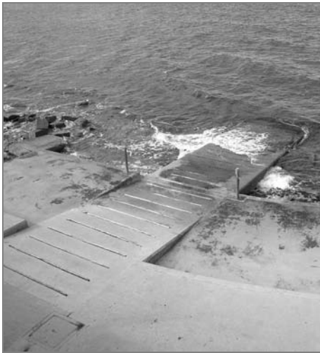
Přístupná pláž s betonovým nájezdem na pobřeží u sousedního města Izola