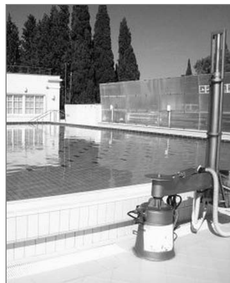
Bazén se zvedákem