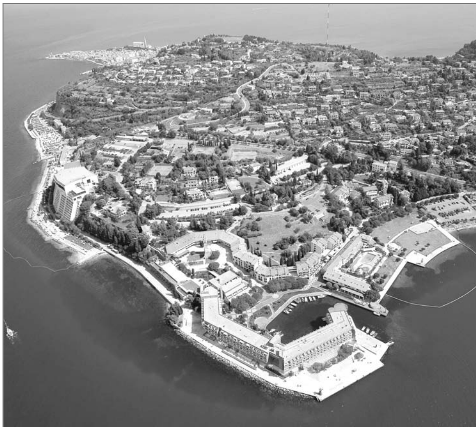
Pohled na západní výběžek Piranského poloostrova nalevo od Portorože