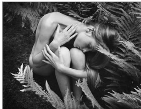
Ilustr. foto: Taras Kuščynskij: Schoulená

Holé šlapky přitlač k sobě a roztoč všechny vášně. Reaguješ promptně, vše směřuje k lásce.