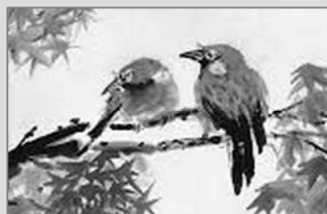
◀ Japonský motiv, pastel (výřez)

Přeložila Hana Klusová