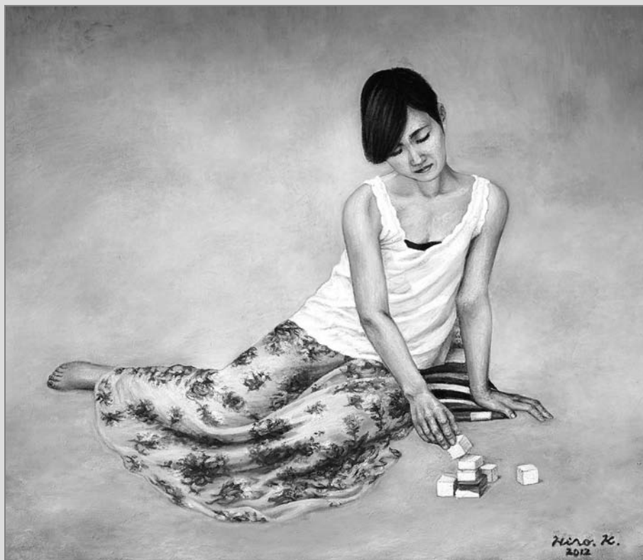
▲ Zasněná, olej 50 x 60 cm

čal zajímat o další malířské techniky: oleje a akvarely. Pravidelně bral lekce u jednoho akademického malíře. V průběhu let se podílel na několika velmi úspěšných výstavách v Japonsku.