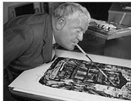
Zakladatel sdružení umělců Erich Arnulf Stegmann (* 4. března 1912, † 5. září 1984 Německo)

Pokud zájemci o malování nemají možnost navštívit výstavu nebo výtvarnou dílnu, mohou se s malíři setkat prostřednictvím krátkých filmů, které jsou umístěny na webu Nakladatelství. Na snímcích se malíři sami představují, ukazují, jak malují atd.