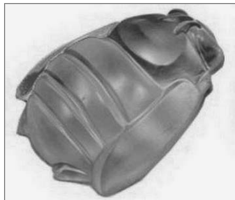
Jednobarevné mýdlíčko z čiré hmoty