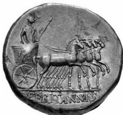
Jedna z mincí s vyobrazením Claudia (20 mm, 7.62 g)