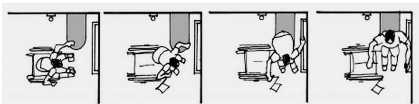
3. varianta, kterou postupuje cca 35 % vozíčkářů

Zdroj: katalog firmy Villeroy & Boch Převzato z publikace: Ing. arch. Daniela Filipiová, Projektujeme bez bariér, 2002 (se svolením autorky)