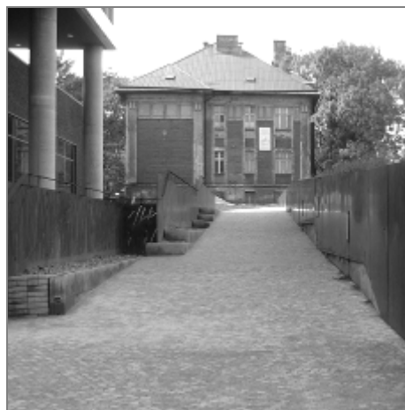
Pohled z opačné strany

Naštěstí stavební úřad Moravské Ostravy a Přívozu smetl ze stolu nepravdivé argumenty, že budovu lze považovat za veřejné prostranství atd. Mimo jiné ani výtah v dotyčné budově nespĺňuje parametry dané právními předpisy. Úřad za to zasluží velkou pochvalu!