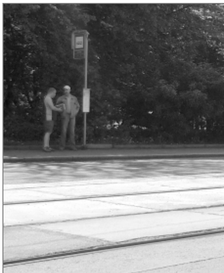
Stávající tramvajová zastávka MHD Kpt. Vajdy v Ostravě-Zábřehu

V letošním roce by se měla upravovat tato tramvajová nástupiště zastávek MHD: Krajský úřad, Křižíkova, Hranečník, Most mládeže a Kpt. Vajdy. Vždy však jsou nějaká „ale“, takže doufejme, že vše bude probíhat bez problémů. Ostrava potřebuje další bezbariérová tramvajová nástupiště jako sůl.