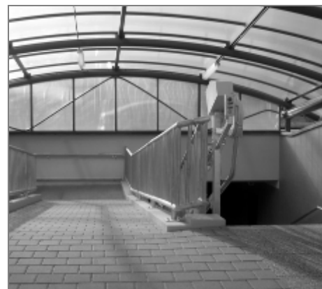
Tady lze použít schody, nájezdy i šikmé schodišťové plošiny

Budu se teď tak trochu popírat, ale nedá mi to. Je mi jasné, že kdyby nebyly tyto plošiny nyní instalovány, určitě by se našel v budoucnu někdo, komu by chyběly a úřad by se octnul na „pranířič“. Osobně si však nejsem jist, zda bylo opravdu nutné šikmé schodišťové plošiny instalovat.