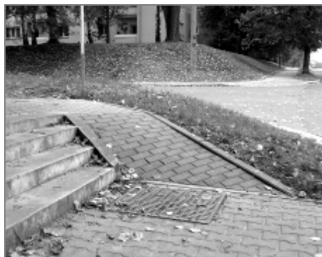
Pohled zespodu: schody a vedle „bezbariérový“ přístup

I na tomto černobílém obrázku je patrné, že zde nebyl dodržen příčný i podélný