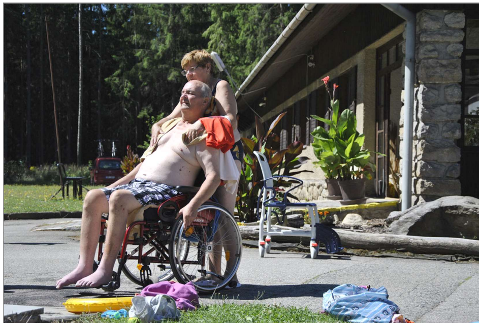
Na dovolené v Březejci si „nabijete baterky“ až do dalších prázdnin

Je to metoda využívaná v psychoterapii k sebepoznávání a terapeutické léčbě skrze různé formy umění. Jakákoli tvorba může být prostředkem sebevyjádření. Toto sebevyjádření v arteterapii využíváme a snažíme se z něj vytěžit něco pro sebe. Arteterapie uvolňuje emoce a podporuje představitivost. Otevírá dveře k našemu nevědomí, tedy tomu, co v sobě máme, i když si to neuvědomujeme.