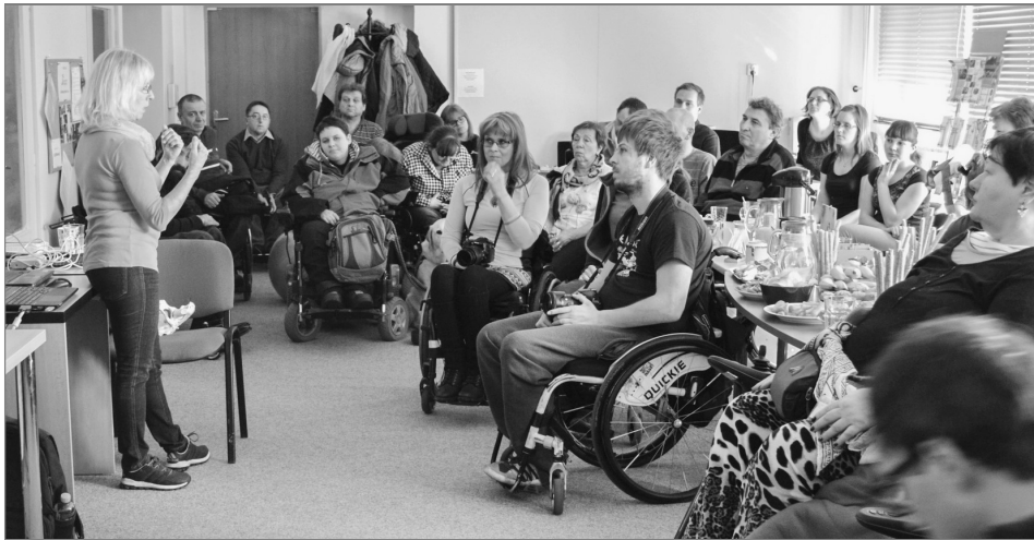
Přednášky a osvětová činnost