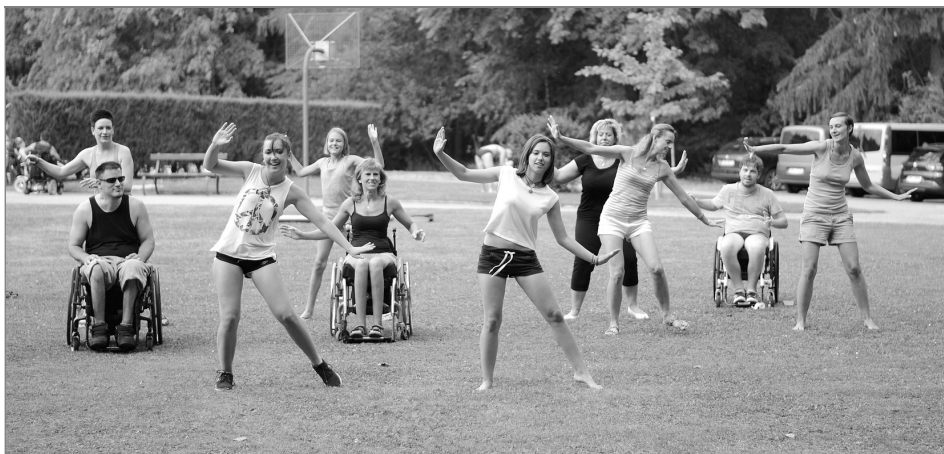
Součástí rekondičních pobytů je i skupinové cvičení

Klientům využívajícím ambulanti služby zajišťuje centrum asistenci při úkonech péče o vlastní osobu, při přesunu z automobilu či při využívání různých rehabilitačních přístrojů.