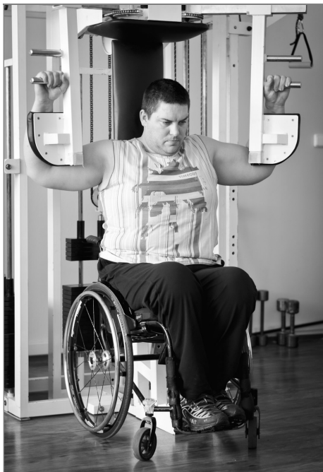
Srovnat ramena vzadu – to je základ

z několika důvodů. Několikrát během dne se musí přesunout – do auta, zpátky na vozík nebo do postele. Pokaždé u toho musí zvedat vlastní váhu, což znamená zátěž pro horní končetiny. V případech, že o něj pečují jeho blízcí, trpí zejména jejich zádové svalstvo. Navíc se stává, že u člověka po úrazu míchy dochází ke zpomalení metabolismu. Bezprostředně po úrazu zpravidla dochází k razantnímu úbytku váhy, neboť člověku ubývá svalová hmota. Poté ale postupně v důsledku nedostatku pohybu většinou přibere – někdo více, jiný méně. A tady bývá kámen úrazu. Pojišťovna totiž přispívá na mechanický vozík po pěti letech, na elektrický po sedmi. Pokud vozíčkář přibere na váze a vleze se obtížně do stávajícího vozíku, hrozí mu vznik dekubitů. I proto je zapotřebí věnovat se správné stravě a pohybovým aktivitám.