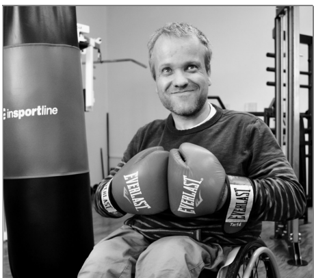
Na vozíku se dá i boxovat