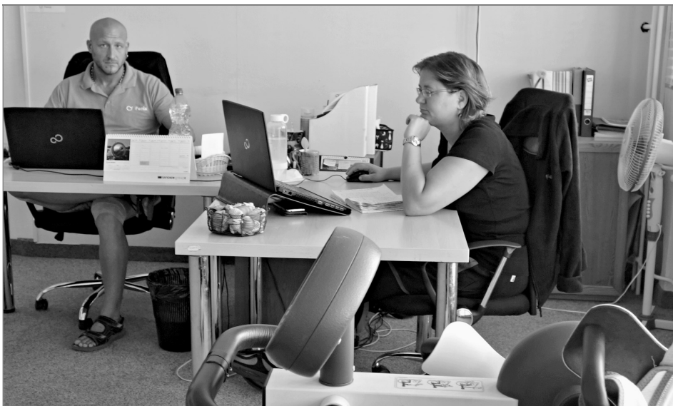
Přijímací kancelář brněnského ParaCENTRA Fenix