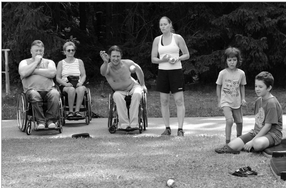
Pétanque – jedna z oblíbených soutěžních aktivit vozíčkářů

V duchu mezigeneračního propojení prostřednictvím kolektivních her se nesl letošní rekondiční pobyt na Březejci. Už první večer se většina klientů zúčastnila hudebního kvízu plného hitů, čímž se tato skupinová aktivita stala skvělým prostředkem k seznámení.