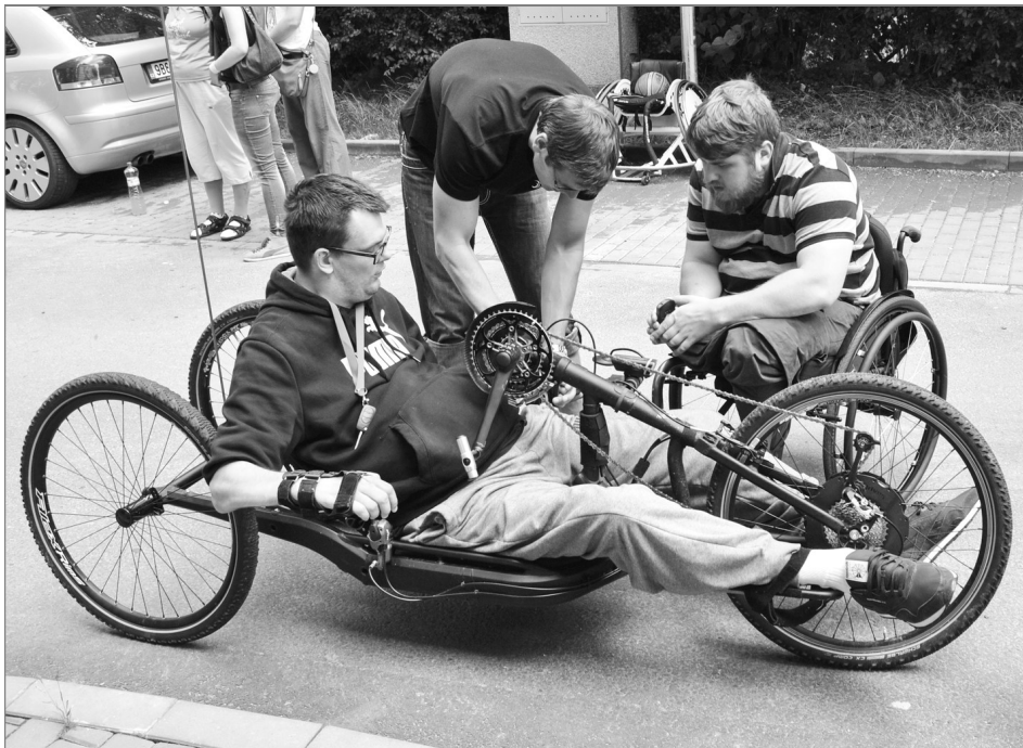
Handbike představuje širší možnosti pro pohyb a výlety lidí s handicapem

Krátce po úrazu Blanka vůbec neuvažovala, že by se vrátila do práce. Vždyť stavebnictví, ve kterém se celý život pohybovala, nepatří mezi odvětví, která se dokážou snadno přizpůsobit práci pro člověka na vozíku. Po návratu z rehabilitač-