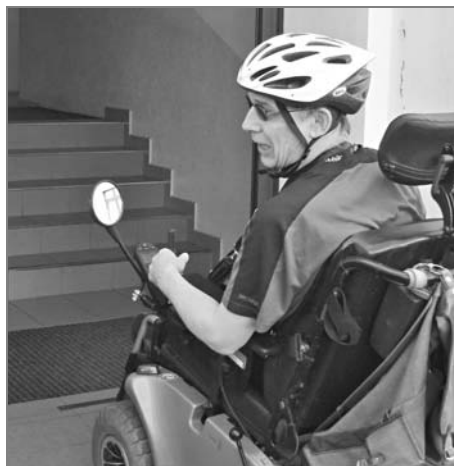
Hlavním vchodem se vozíčkář do budovy nedostane