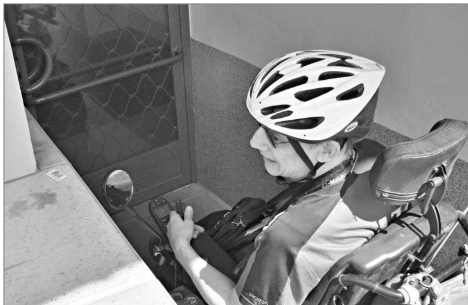
Stísněné podmínky zadního vchodu už leccos signalizují

„Fascinuje mě, co všechno dokáže člověk vymyslet, jak to funguje a slouží lidem. Například kochleární implantáty do ucha a vlastně veškerá protetika... Akorát to má vadu, že je to drahé a řada lidí si to nemůže dovolit. A vůbec, přestože to vy-padá, že se neustále chechtám, je pár věcí, které mě fakt štvou. Především