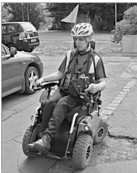
Ostatně, ani tv ulice nejsou nic moc