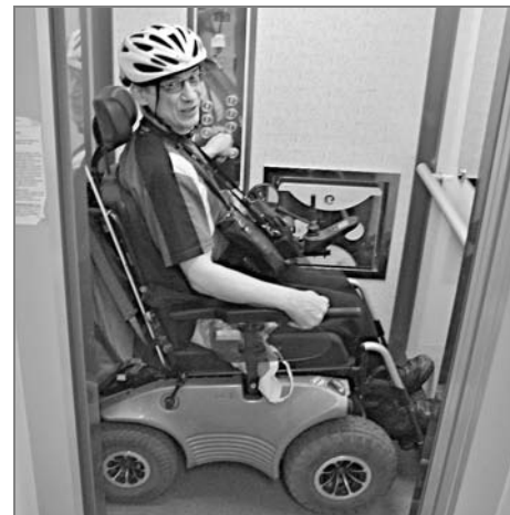
Výtahem se lze do patra dostat – ale z výťahu už ne